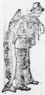
Az Emulsió vásárlásánál a SCOTT-féle módszer védjegyét — a halászt — kérjük figyelmébe venni