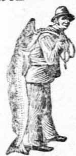
Az Emulsió vásárlásánál a SCOTT-féle módszer védjegyét — a halászt — kérjük figyelembe venni

a SCOTT-féle Emulsió akkor is, mikor más szer már nem használ. Mindig veszélyes kétes értékű szerekkel kísérletezni, amikor az ember egészségéről van szó. Gyengeség esetében különösen lábadozóknál, vagy vérszegénység, tüdőbaj, tulterhelt munkából származó betegségek folytán az elővigyázatos ember azonnal ahhoz a szerhez folyamodik, mely számtalan esetben, kivétel nélkül megbízhatóan hat. Ez a szer