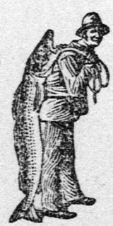
Az Emulsió vásárlásánál a SCOTT-féle módszer végiggyét — a halászt — kérjük figyelmebe venni. Kapható minden gyógytárban.

Orvosok és bábák az egész föld kerekén állandóan ajánlják a