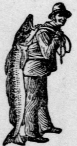
Az Emulsió vásárlásánál a SCOTT-féle módszer védelmét — a halászt — kérjük figyelembe venni.