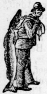
Az Emulsió vásárlásánál a SCOTT-féle módszer védelmét — a halászt — kérjük figyelembe venni.

Ugyan adjatok a szenvedőnek SCOTT-féle Emulsiót és kiméjétek meg álmatlan éjszakát. A fogak minden fájdalom és bélbaj nélkül bujnak elő, fehérek, erősek és egyenesek lesznek.