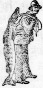
Az Emulsió vásárlásánál a SCOTT-féle módszer védje- gyét — a halászt — kérjük figye- lembe venni.

Ugyan adjatok a szenvedőnek SCOTT-féle Emulsiót és kiméjétek meg álmatlan éjszakától. A fogak minden fájdalom és bélbaj nélkül bujnak elő, fehérek, erősek és egye- nesek lesznek