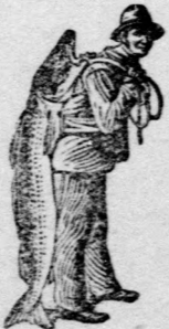
Az Emulsió vásárlásánál a SCOTT-féle módszer védelmét — a halászt — kérjük figyelembe venni. Kapható minden gyógytárban.

Nyáron is legjobb eredményel adagolható.