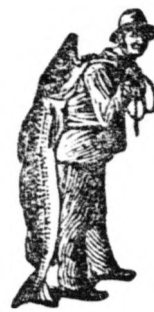
Az Emulsió vásárlásánál a SCOTT-féle módszer védjegyét — a halászt — kérjük figyelembe venni.

Az arc megpirosodik, megtelik és az életkedv visszatér mindazok meglepetésére, a kik először használják a