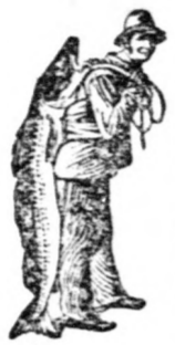
Az Emulsió vásárlásánál a SCOTT-féle módszer védelmét — a halaszt — kérjük figyelembe venni.

levő tiszta és könnyen emészthető táplálék, gyorsan jóváteszi a táplálkozásnak akármely fogyatkozását.