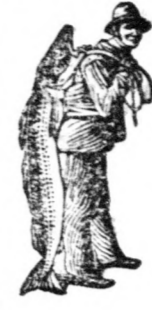
Az Emulsió vásárlásánál a SCOTT-féle módszer végéig — a halászt — kérjük figyelembe venni.

Adjon neki SCOTT-féle csukamájolaj Emulsiót és örömmel fogja tapasztalni, hogy állapota azonnal jobbra fordul, hogy csakhamar fejlődésnek indul és jókedvűvé válik.