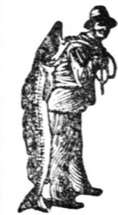
Az Emulsió vásárlásánál a SCOTT-féle módszer védelmét — a halászt — kérjük figyelembe venni.

tisztaságával, emészthetőségével és gyógyító erejével nagy hírnévre tett szert.