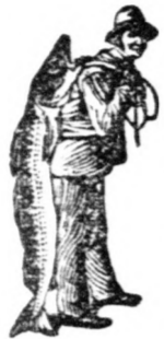
Az Emulsió vásárlásánál a SCOTT-féle módszer véglegesét — a halászt — kerjük figyelembe venni.

kellemesen emészthető formában tartalmazza éppen azokat az anyagokat, amelyek megkiváncsoltak fehér, egyenes és erős fogak növesztéséhez.