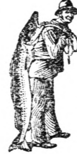
Az Emulsió vásárlásánál a SCOTT-féle módszer védelmét — a halászt — kerjük figyelmébe venni.

Egy kisérlet meg fogja Önt győzni, hogy az ön esetében is mily jótékony hatású