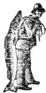
Az Emulsió vásárlásánál a SCOTT-féle módszer védjegyét — a halászt — kerjük figyelmebe venni.