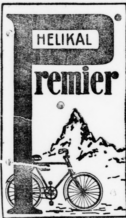
Képviselet: Rude József és Társa Sátoraljajhely.

Vasuti állomás. Posta és távirtd. 230 méter magasságban fekszik a tenger színe felett. Fürdőidény május 1-től szeptember 30-ig. Gyönyörű fekvés, ózondus kársfa- és fenyőerdők. Kényelmes és olcsó ellátás, modern berendezés, hidegvíz-gyógyintézet, só- és fenyőbélőző termek (Inhalatorium), savanyúvízes és vasas ásványvíz-fürdők, orvosi felügyelet alatt álló kitűnő vendéglők. Gyógyvíze kitűnő hatásu tüdőbajok, malária (mocsárláz), gégehög és tüdőbajok, máj- és lépdegánatok, hólyagurult, specífus a görvélves esontbántalmaknál. Mindenféle idegbántalmak, fejfájás, migraine, hisztéria, szédülés, nehéz légzés, hipochondria, vérhajók, köszvény, görvél, bujakór, delirium trem. potat. Női bajok, sápkór, havi zavaroknál. — Részletesebb felvilágosítással szolgál a fürdőigazgatóság, Hársfalva (Beregmegeye).