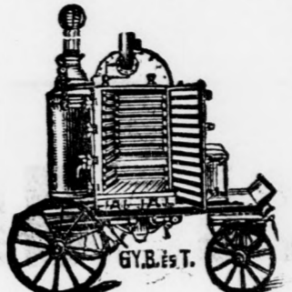
4 kerekű kivitel.