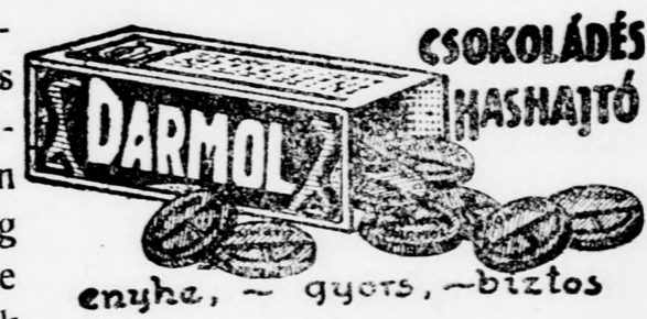
enyhez, — gyors, — biztos

— Vegye meg az „Agraria” huskonzerva patkányirtószert. — Kapható gyógyszerárban, drogeriában és a készítőnél Standard, Budapest, Kossuth Lajos u. 14.