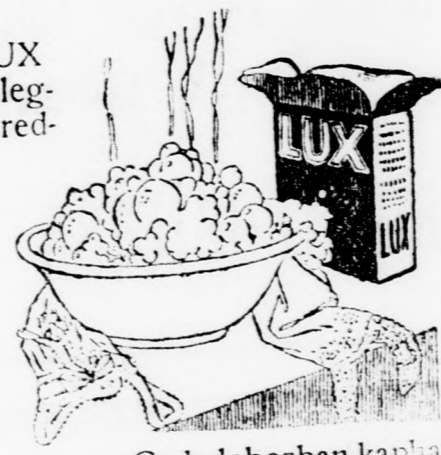
Csak dobozban kapható

— A Hegyaljai Mulató megnyitása jun. 5-én délután. — Autobusztjárat.