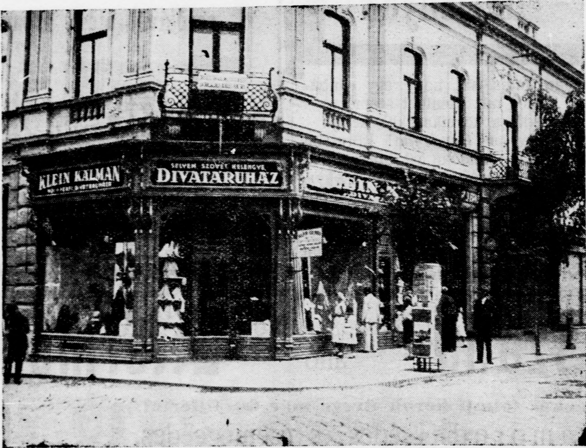
A dúsan felszerelt Horthy-téri divatáruház