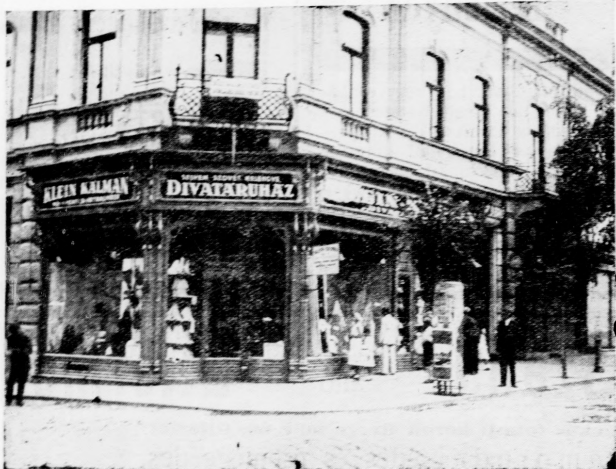
A dúsan felszerelt Horthy-téri divatáruház