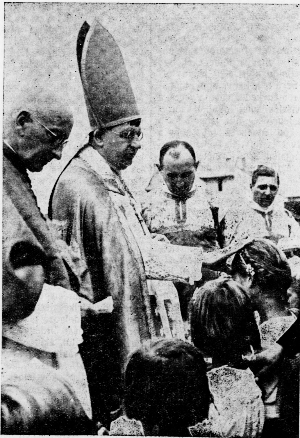
Dr. Serédi Jusztinián biboros hercegprimás bérmál