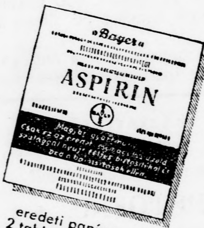
eredeti papírcsokó 2 tablettával 24 fillér