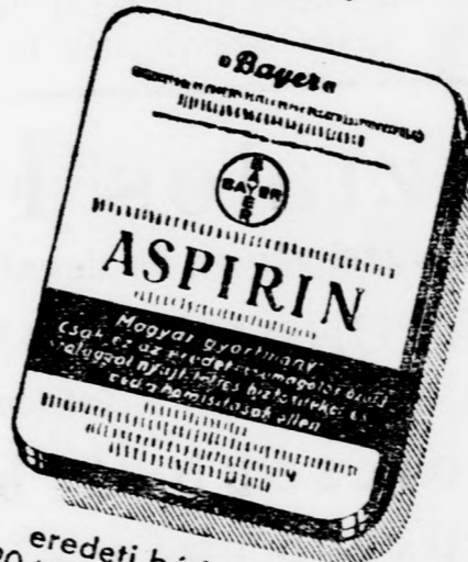
eredeti bádogdoboz 20 tablettával 1.80 pengő

1 tableta ára 12 fillér »Bayer« -kereszt nélkül nincs Aspirin-tabletta! Aspirin-tabletták csak gyógyszerárakban kaphatók!