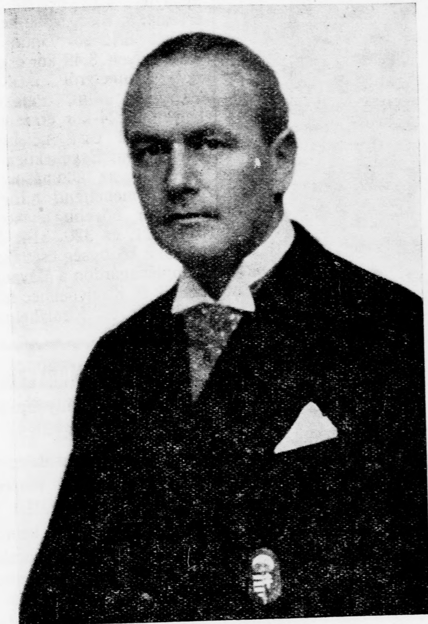
Vitéz LUKÁCS BÉLA földmivvelésügyi államtitkár, a Magyar Élet Pártja zemplénmegyei listavezetője

elnöki tisztségéről lemondott. Magyarország kormányzója 1938 tavaszán vitézzé avatta. Az alsóborsodi református egyházmege, valamint a tiszáninneri református egyházkerület világi tanácsbírája.