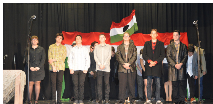
Emlékezés az aradi tizenháromra és az 1956-os forradalom és szabadságharc hőseire Beszámoló a 4. és az 5. oldalon