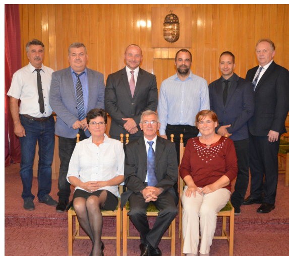
Kunszentmárton Város Képviselő-testületének alakuló ülése - részletek a 3. oldalon