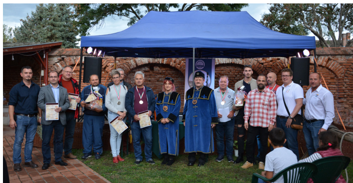
Múzeumok Őszi Fesztiválja - Őszi est a múzeumkertben - Beszámoló a 10.oldalon