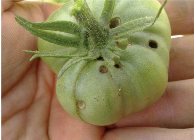
Peronoszopóra levéltünet és gyapottok bagolylepke kártétele paradicsomon

A gyapottok bagolylepke neve ismerős lehet a kertészettel foglalkozók körében. Korábbi tudásunk szerint ez a vándorlepkéfaj a Földközi-tenger vidékéről települ be hazánkban a kora nyári időszakban. Mivel melegigényes, így az őszi első fagyokkal az itthon élő populáció elpusztul. Úgy gondoltuk, hazai áttelelése nem lehetséges. Ennek mondanak ellent az idei év tavaszán megjelent eredmények, melyek szerint idén már igen korán megjelentek az első példányok, ami arra enged következtetni, hogy az enyhülő teleinken az áttelelése lehetőségessé vált.