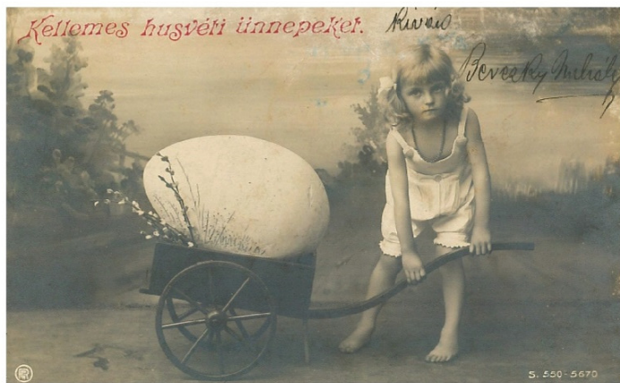
Húsvéti üdvözlőlap, 1906.

A 19. század végén a kunszentmártoni boltosok már széles kínálatban árusították illatos locsolóvizeiket, de valószínű, hogy a legtöbben mégis a jól bevált, korlátlan mennyiségben rendelkezésre álló kútvizet választották. Egykor a humor és a jókedv is fontos része volt az ünnepnek. Tudunk egy kunszentmártoni legényről, aki 1905-ben három ló vontatta tíz akós lajtos kocsival járta a lányos házakat. Fogadtatásáról és későbbi sorsáról nem szól a krónika. A kora tavaszi napok hűvös időjárása aligha kedvezett a nagy mennyiségben érkező hideg locsoló folyadékknak, így a vödörket és kannákat idővel a kölnisüvegek váltották fel, de akadnak olyan férfitársaim, akik ma is a szódásüvegre esküsznek.