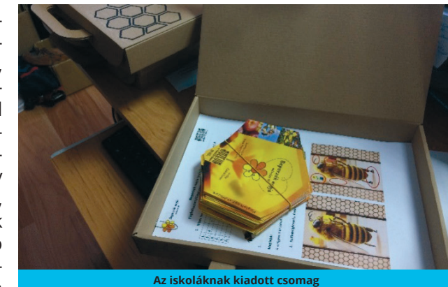
Az iskoláknak kiadott csomag