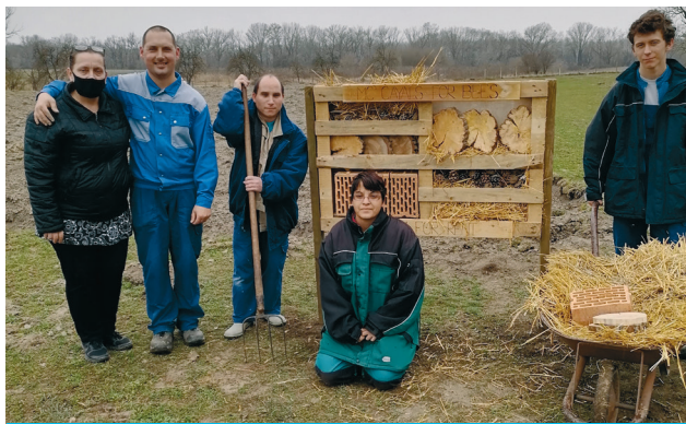
A Szőke Tisza Otthon díjnyertes rovarhotele

Ez a beporzás. Ha a beporzó rovarok nekünk, értünk (is) dolgoznak, nekünk kötelességünk védelmezni és segíteni őket. A tavalyi évhez hasonlóan a kunszentmártoni Helytörténeti Múzeumban idén is igyekeztünk tenni a Beporzók Napja (március 10.) természetvédelmi jeles nap alkalmából ezekért a rovarokért. Mivel személyes jelenléte igénylő rendezvényt nem szervezhettünk, összetett módon fizikálisan kiadható és online térben megvalósuló lehetőségeket kínáltunk a lakosság számára. A „programsorozat” a Beporzóbarát címet viselő felhívással kezdődött, aminek célja, hogy az emberek rovarhoteleket építsenek, ezzel segítsék a beporzó rovarokat. A más néven méhecskehotel, rovar tanya vagy darázs garázs néven is emlegetett természetvédelmi eszköz fészkelőhelyet biztosít a számunkra is igen fontos gyümölcsök és zöldségek megporzását végző fajok számára. Mivel ez az építmény pár alapvetően meghatározó tulajdonságon kívül (pl.: legyen benne 8-10 mm átmérőjű csőszerű mélyedés) nagyon színes és egyedi módon kivitelezhető, ezért a hasznosságon túl kellemes időtöltést is jelent az alkotó számára. A felhívásra jelentkezők alkotásai a múzeum facebook oldalán nyilvánosság elé kerültek, ahol bárki szavazhatott a neki tetsző rovarhotelre. Ennek eredményeképpen a tiszauji Szőke Tisza Otthon lakói és kollégái ajándécsomagot kaptak, az ő győztes alkotásukra több, mint 500 szavazat érkezett.