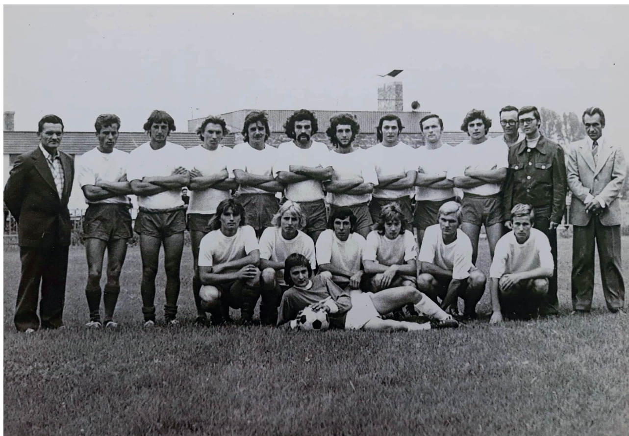
fotón a feljutó csapat kerete