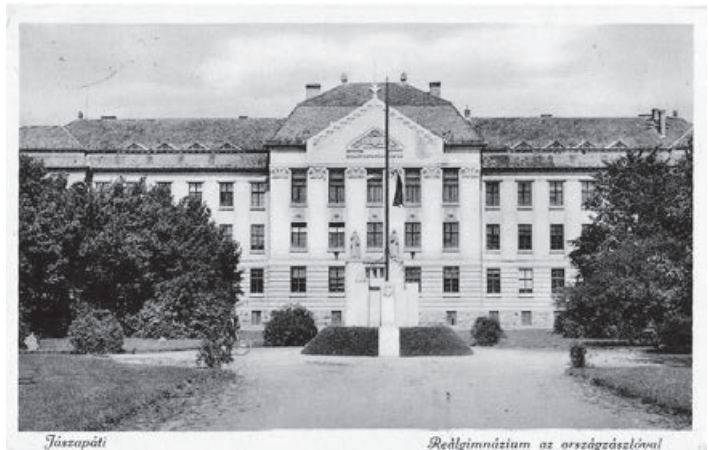
jászapáti gimnázium épülete 1934-ben.

„Kocsér képviselő-testülete hasonlóképpen nyújtott segítséget, hivatkozván a „jó rokoni viszony ápolására és fenntartására. „Hogy pedig a helybeli szegényebb sorsú lakosság arra érdemes fiainak a gimnáziumban való taníttatását a község tehetségéhez mérten megkönnyítse, szívesen elhatározza, hogy egy ily, legalább jó eredménnyel tanuló kocséri fiú részére a község házi pénztárából a gimnáziumi tanulmányok befejeztéig – a folyó szeptember hava 1-től, havi előleges részletekben 200, azaz kettőszáz korona segélyt ad; de hogy e segélyt ki kapja, annak elhatározást a képviselő-testület magának fenntartja.” Kelt Kocséron, 1912. március 12-én. (A Jászapáti királyi Katolikus Főgimnázium Második Értesítője, 1913-14. 40. p. A Jászapáti és Kocsér szoros kapcsolata akkor még közismert volt a magasabb iskolákat nem végzett lakosság körében is Az 1900-as évek ele-