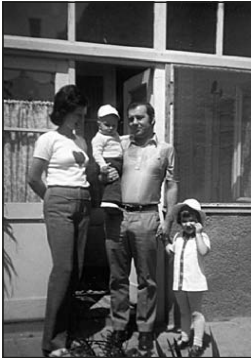
Családi körben a rendelő udvarán, ami akkor még szolgálati lakásként is szolgált a '70-es években

– Még van egy évtized? Te jóisten, hát mit is csináltunk? Dolgoztunk. Akkor már volt központi ügyelet, amiben kezdetben részt vettem, de aztán az idősebb orvosokat mentesítették. Kicsit az egészségem megroggyant, én is beleestem abba a hiába, amibe általában az orvosok, hogy a saját betegségeimet elhanyagoltam. De jött néhány jelzés, és azóta, kérlek szépen, kezdtem komolyan ven-