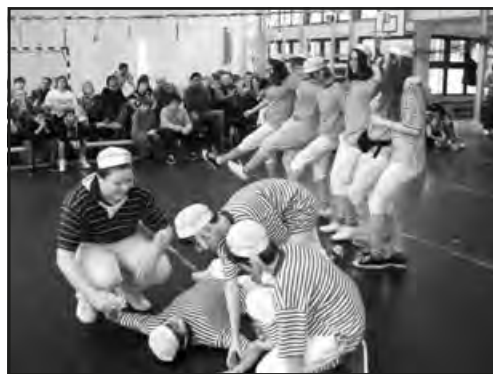
A legjobb koreográfia: Részeg tengerészek – a 7. osztály