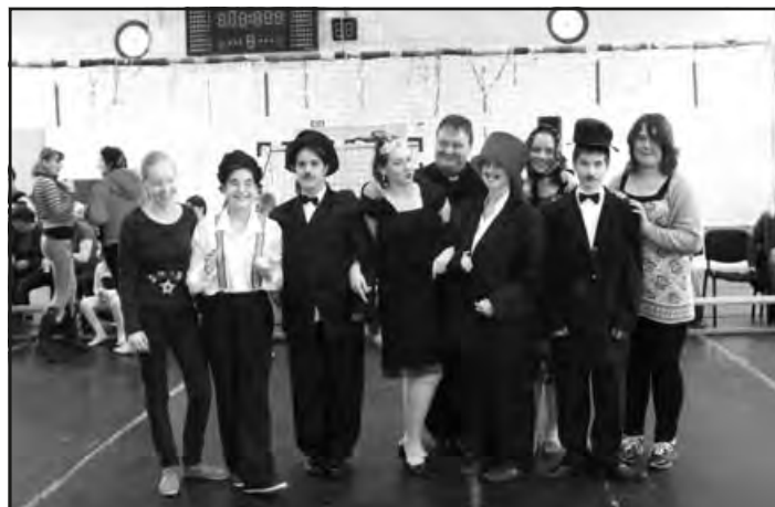
A legötletesebb csoport: Mozi – fekete-fehérben – a 8. osztály