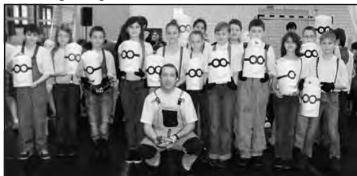
Legvidámabb produkció: GRU - az 5. osztály