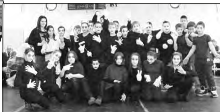
A legeredetibb jelmez: A pantomimosok – a 6. osztály