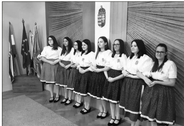
A felvételek 2021. március 7-én készültek a Kocséri Polgármesteri Hivatal dísztermében.