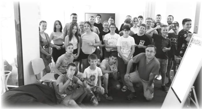
A táborok az Egyházmegyei Katolikus Iskolák Főhatóságának támogatásával valósultak meg.