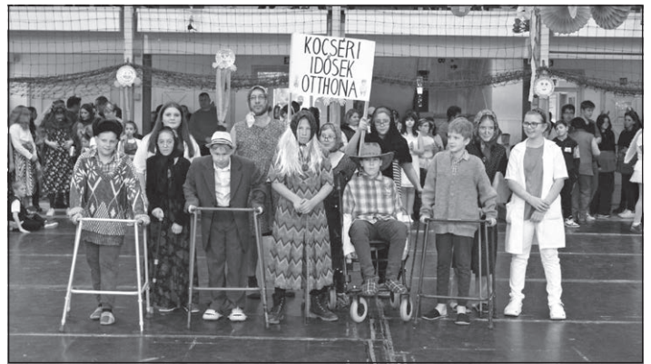
A kocséri idősek otthona – 5. osztály