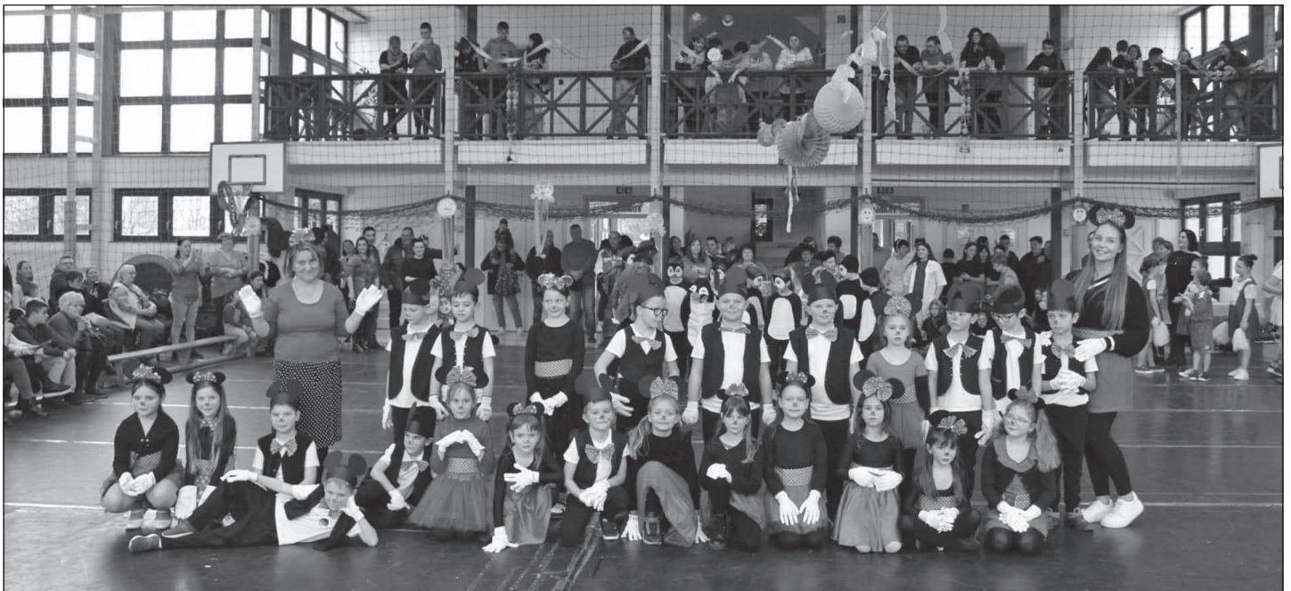
Mickey és Minnie egerek – 1. osztály