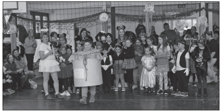
Halvány lila dunsztom – van!