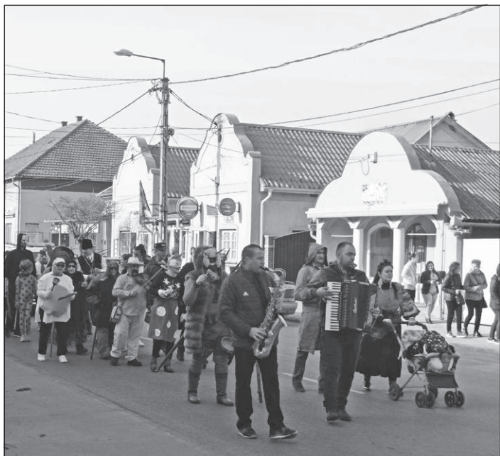
A Kocséri Népkör farsangi felvonulást rendezett 2024. február 17-én.