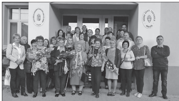
Középpütt mosolyogva - 2018-ban, tanítványai 30 éves találkozásán