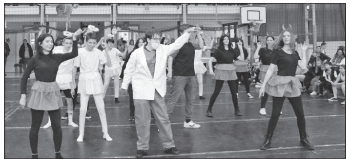
Angyali ördögök 8. osztály