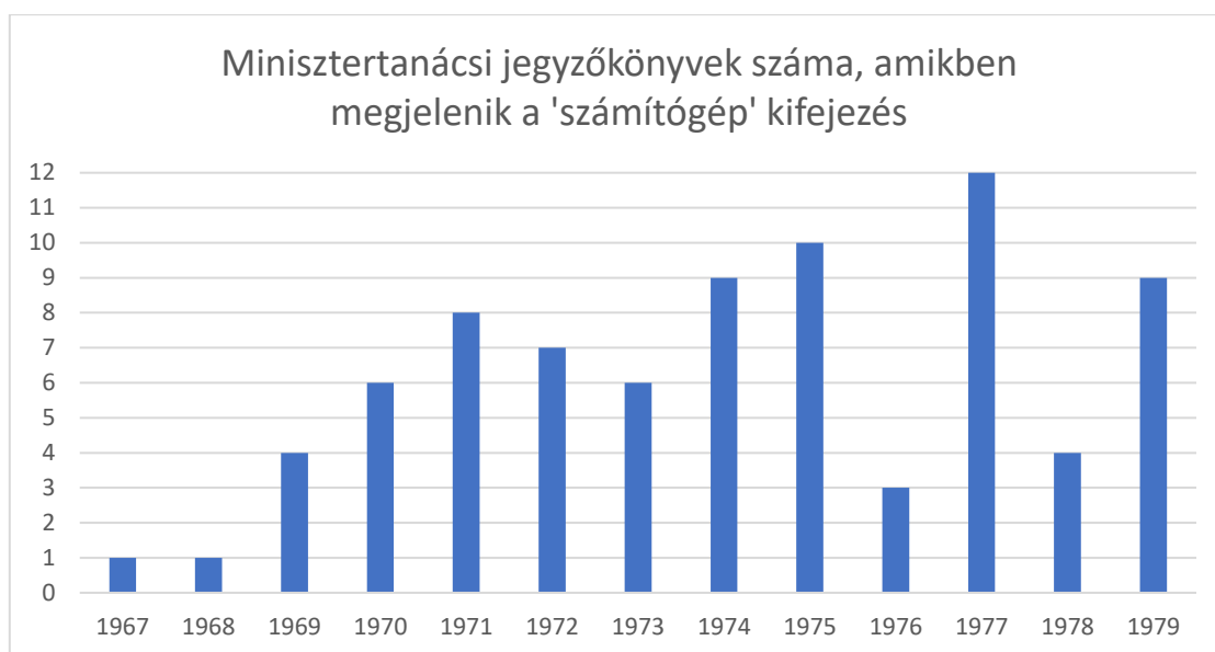
1. ábra A vizsgált dokumentumok időbeli eloszlása

A vizsgált időszak határait 1967 és 1979 jelenti, egyrészt az adatbázis feldolgozottságának mértéke miatt, másrészt a téma jellegéből adódóan, hiszen a SzKFP kezdete 1967-1968-ra nyúlik vissza, és a program szakaszolását is 5 éves tervekben képzelte el a politika (1971-1975, 1976-1980), amit nagyjából le is fednek a feldolgozott források. A történetből csak a folyamat elejét emelem ki, egyfajta szeletként, ami az 1967 és 1971 közötti periódust jelenti: ennek kezdetét az Új Gazdasági Mechanizmus bevezetésével párhuzamosan megélenkülő nemzetközi kapcsolatok jelzik.