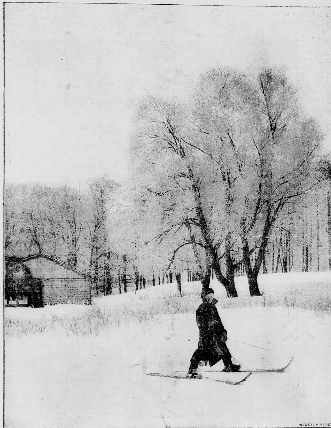
A TÁBSZÁNKÓ (Szki).

Az ötödik ezt beszélte: A pillangó s az aranyos harmat oly szívesen vettek volna egy kis napsugarat, hogy szinpompájukat csillogtathassák benne fürödve. Ekkor én megjelentem a rózsalugasban s gyönyör volt nézni, mily vígan