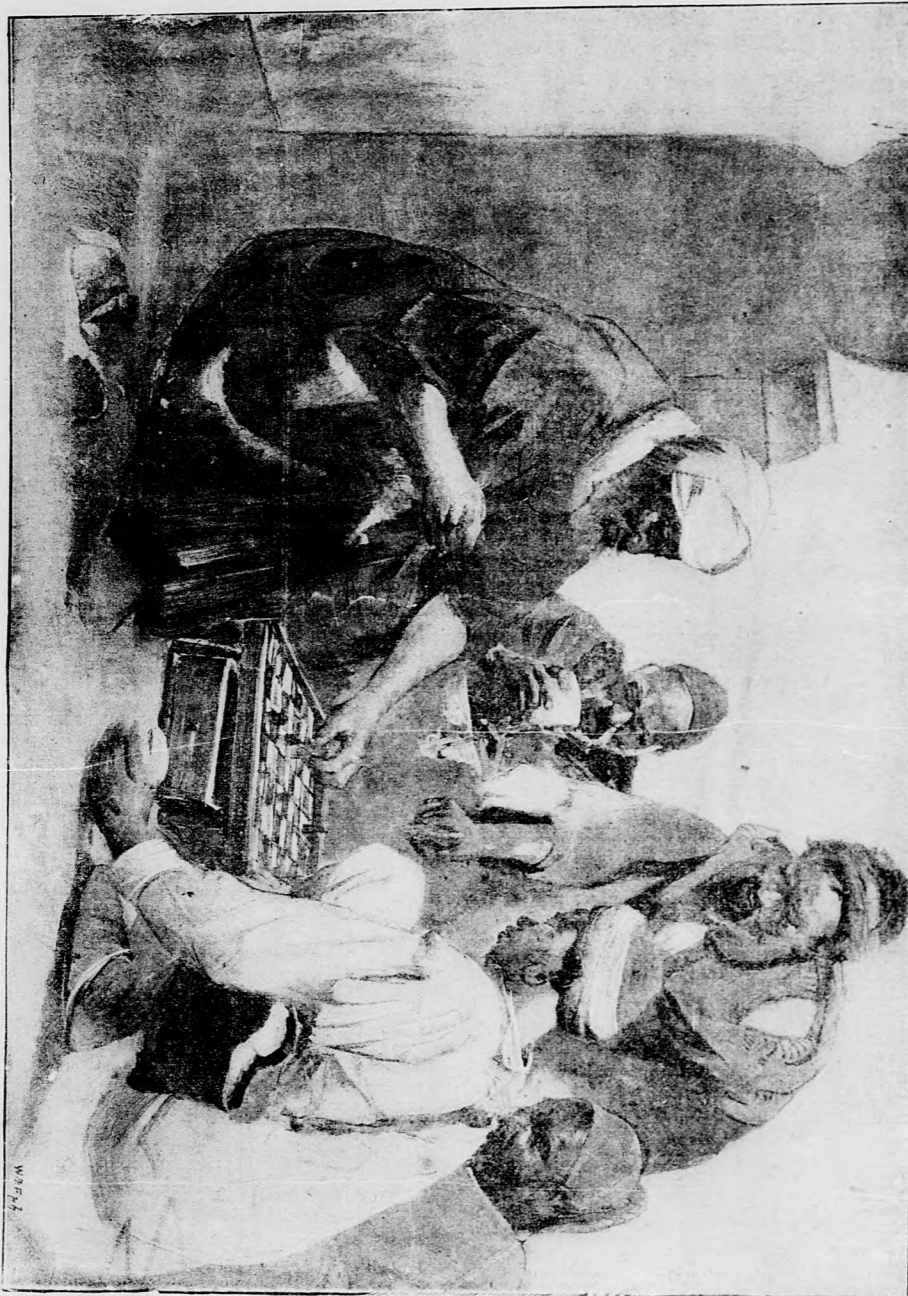
EGY JÁTSZMA SAKK.

A szabadkai főgymnasium mostani régi épülete helyett, melybe több mint 900 tanuló jár, a tanári kar a várostól új intézet építésére kért segílyt.