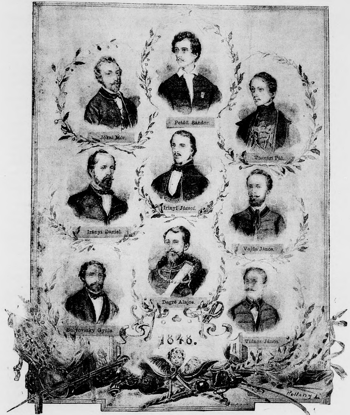
A MÁRCZIUSI IFJUSÁG VEZETŐI.

Bogdán Mátén legszebb mentéje volt. Nyuszt- prémmel volt bélelve, drágakövekkel ékesítve s egész a kordován csizmája száráig leért, sőt mikor lóra ült, a bokáját is verte, arannyal volt a szövete átseve, de zsinór nem volt rajta, mint a mostani diszmagyar mentéken és nadrágokon, mert ez még akkor nem volt divat, csak körülbelül száz évvel később jött divatba. Szép aranyozott kard esőrgött az oldalán, gyémánt forgó a kalapjában s úgy rugtatott be a várba.