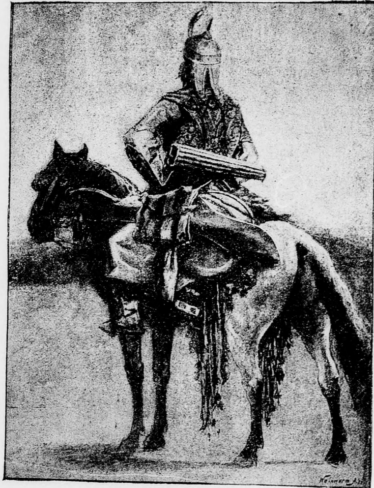
Részlet Feszty Árpád «Honfoglalás» cz. képéből.

Székelyudvarhelyi r. k. főgimnázium. Magyar nyelv. 1. A drámai jellemet a lelki tulajdonok összhangja alkotja. 2. Az égi-háboru jelenségei és fizikai okai. 3. A mennyiségtan haszna. A viszonyok-, egyenletek-, a végtelen sorok és a természettudományokra való tekintettel.