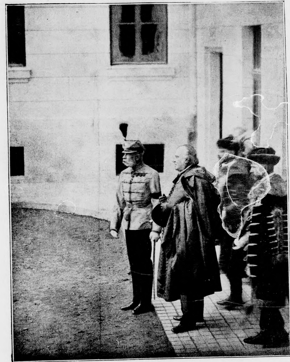
A KIRÁLY SZÁSZ D. PÜSPÖK ES BÁNFFY MINISZTERELNÖK KISERETÉBEN MEGNÉZI A KOLOZSVÁRI REF. THEOLÓGIÁT.

Indítottam szörnyű inkvizíciót, tartottam a legujabb humánus pedagógiai elvek alapján egy becsületérzésre támaszkodó „vád-, véd és puhatolódzó beszéde”.