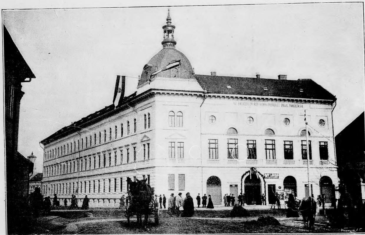
A REF. THEOLÓGIA ÉPÜLETE KOLOZSVÁRON.

Nagy panaszszal jött hozzám a fűszerkereskedő fia, a ki jó husban levő, felgyűrűzött ujjacskáju vitéz, egyébíránt haszontalan fráter. Szereti felhánytorgatni, hogy a főispán is az apja boltjából veszi a cukrot, kávé, rumot: