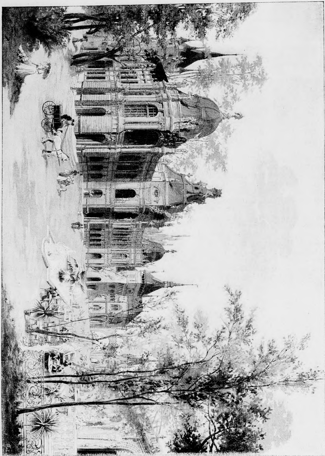
Millenniumi történelvi kiállítás : renaissance udvar.