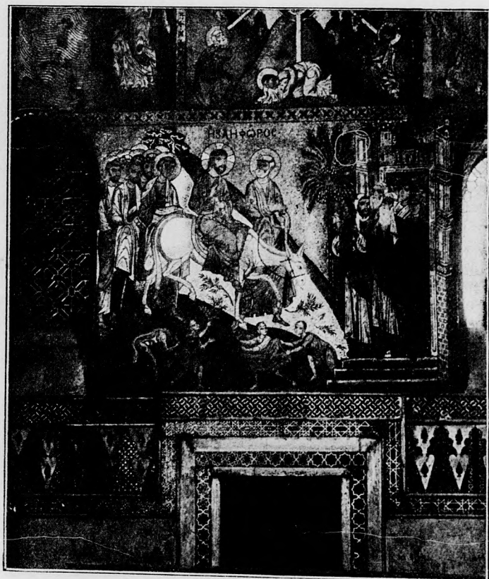
Palermo mozaik a capella palatinában.

Ez a gyászos emlékű öldöklés tanulságul szolgálhatna arra, hogy nem jó trófalni a sicíliai néppel. A jó öreg aztán folytatta a kalauzolás a templom melletti klastrom udvarán. A klastromból most még csak az oszlop és boltíves tornászudvar látható. Ebből is egyes oszlopok le-