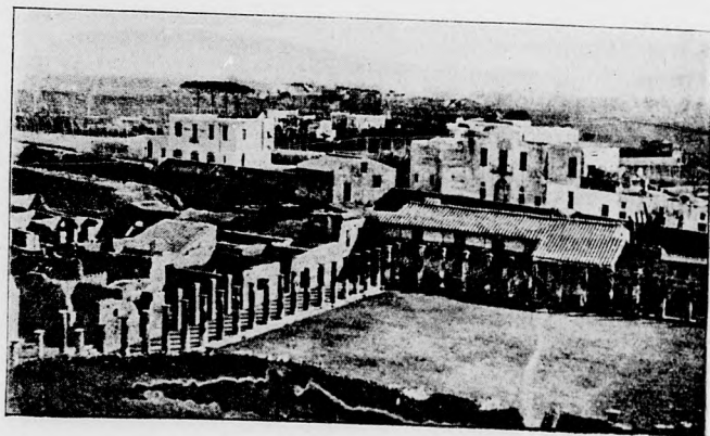
Pompei: A bajvivók kaszárnyája.

Azon nemzeties irány, a melyet a római nép életének minden mozzanatában követett, a római ház építészeti stílusában is nyilvánul. A ház utcára néző fala minden dísz nélkülöz, még ablak is ritkán nyílik erre, legfeljebb a bolthelyiségek czégre tarkítja a házsorok egyszerűségét.