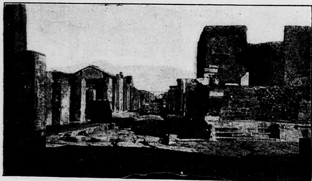
Pompei: A Fortuna-utca.

Sok hosszabb rövidebb utcán keresztül a visszhangzó ásóütések zaja között elérkezünk a város másik végére, a hol egy régi görög templom romjai mellett egy körben fölfelé emelkedő sorokkal ellátott helyet találunk,