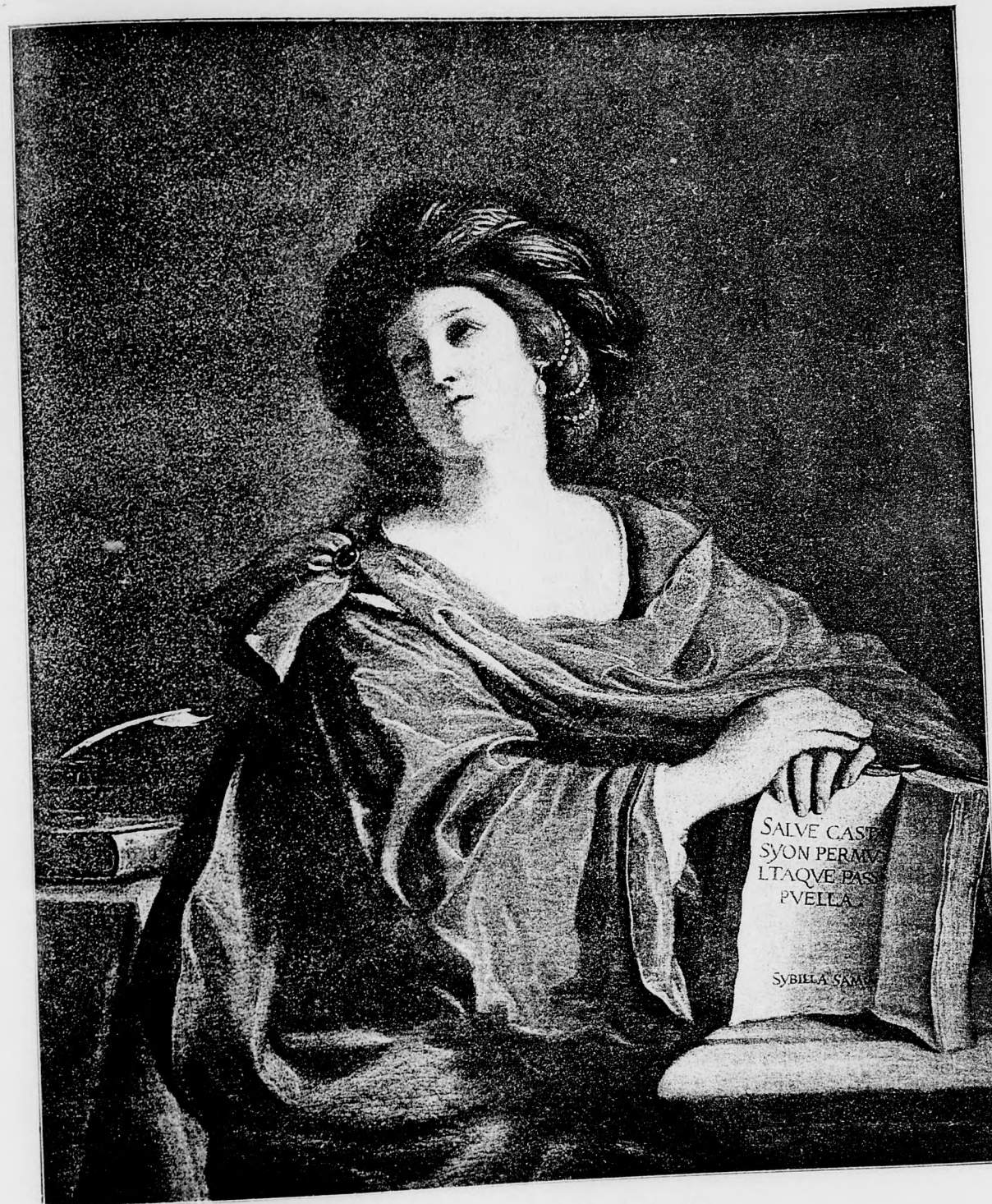
A szamoszi sibilla. Barbieri festménye után.