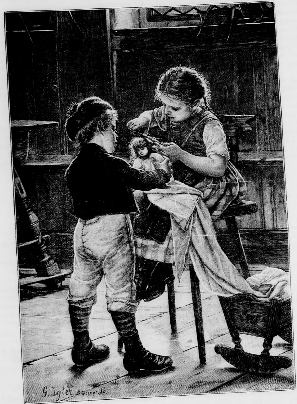
A KIS BORBÉLYOK.