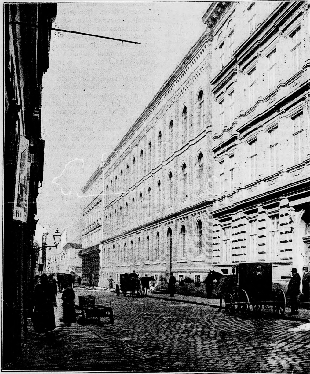
AZ ORSZ. NŐKÉPZŐ EGYESÜLET LEÁNYGIMNÁZIUMA.

szerzésében sohase fáradj ki! Ifjkorodban kell jövedődnek alapját megvened és magadat kiképezned arra, hogy majd a létért való küzdelemben győzedelmeskedjél és méltó helyet