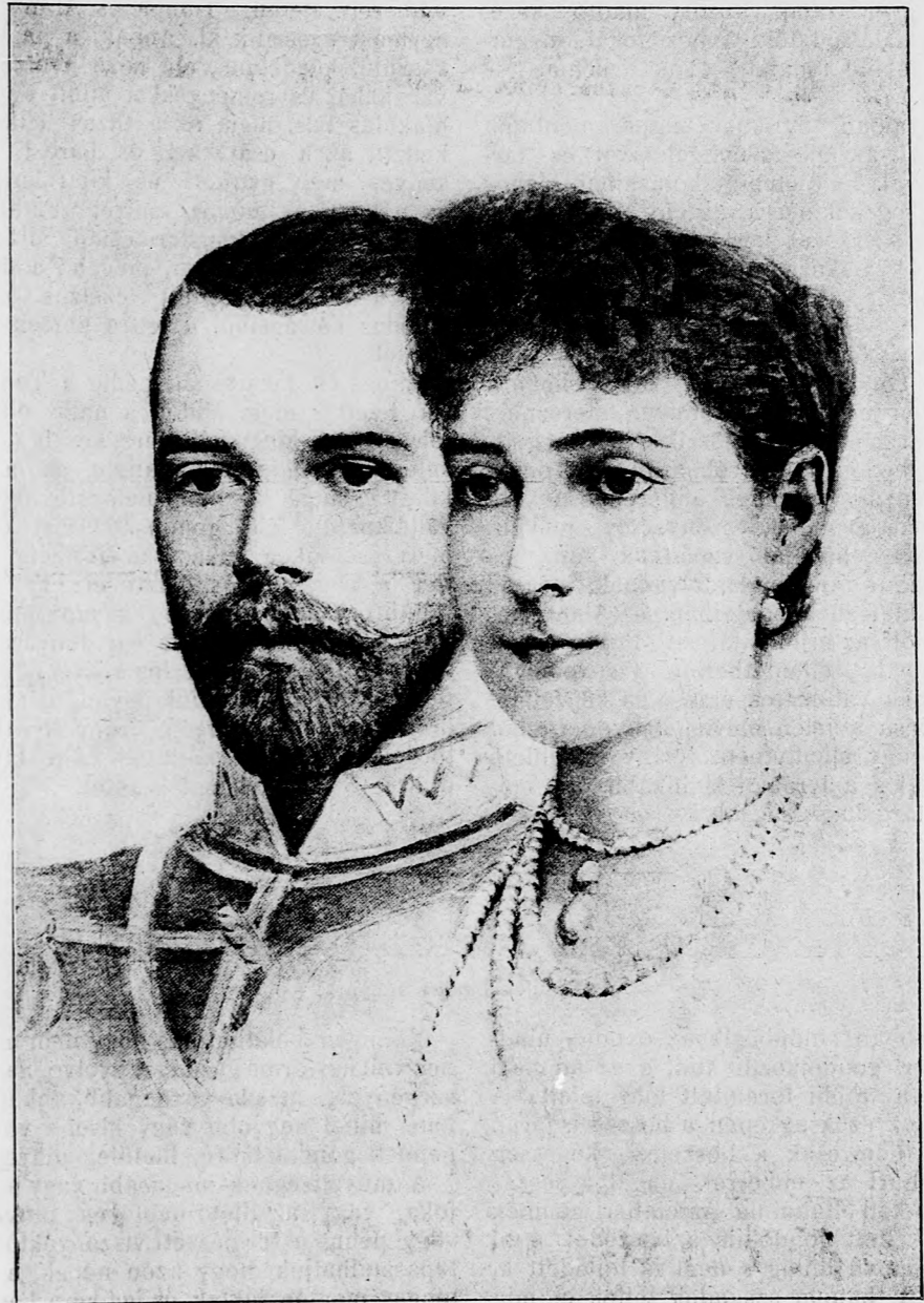
A CZÁRI PÁR.