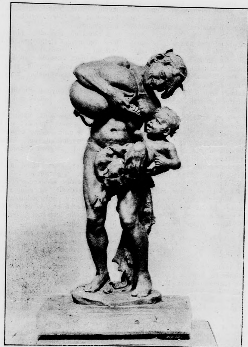
A KIS BORNEMISSZA.