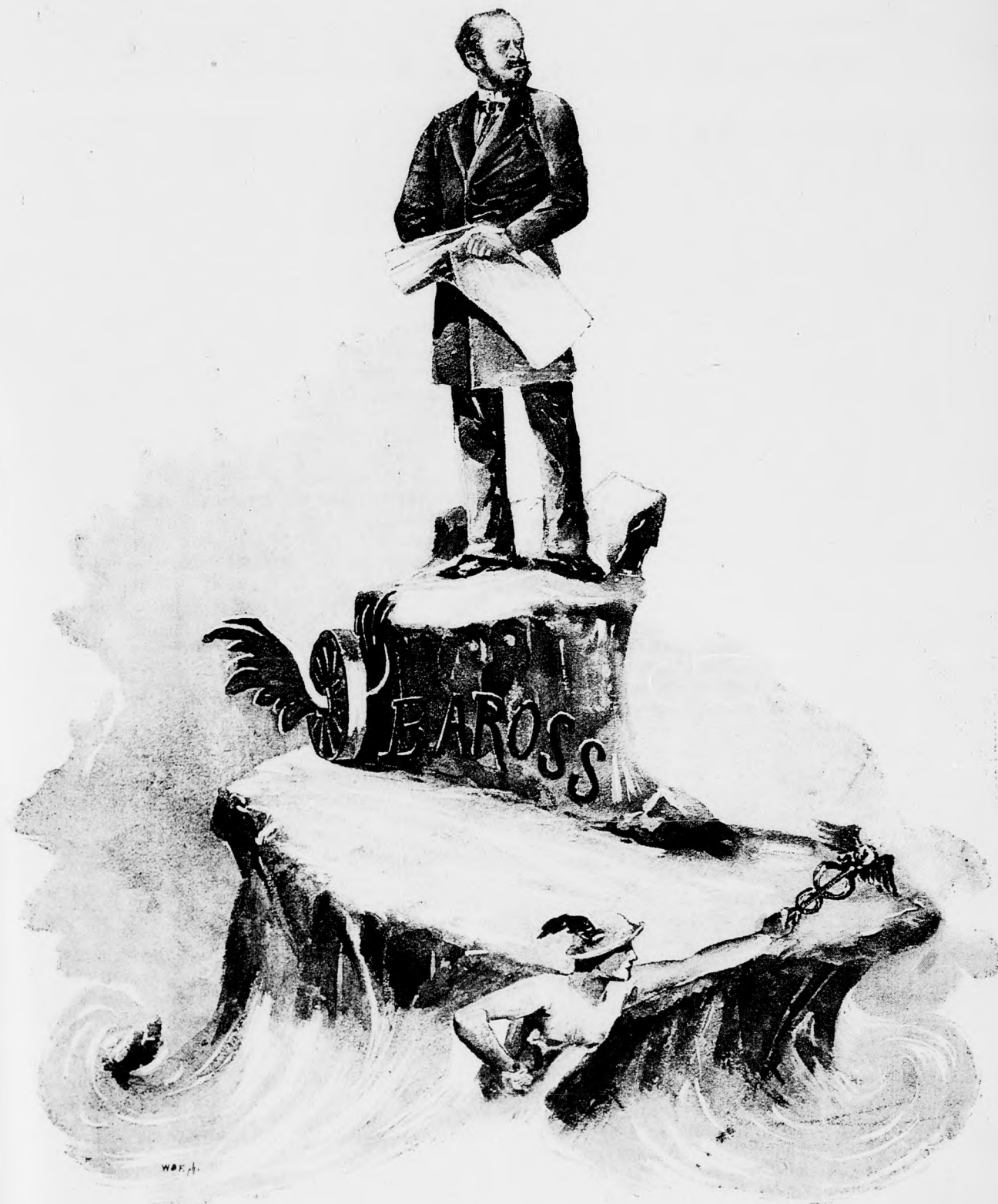
BAROSS GÁBOR SZOBRA.