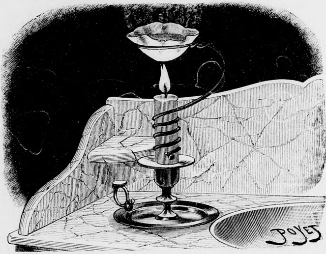
Víz forralás papíroson.

Hogy a papíros sértetlen marad, mintha fém-bőlvaló volna, annak oka az, hogy a hőt, melyet a lángtól kap, rögtön átveszi tőle a víz, mely aztán gőzalakban száll vele odább.