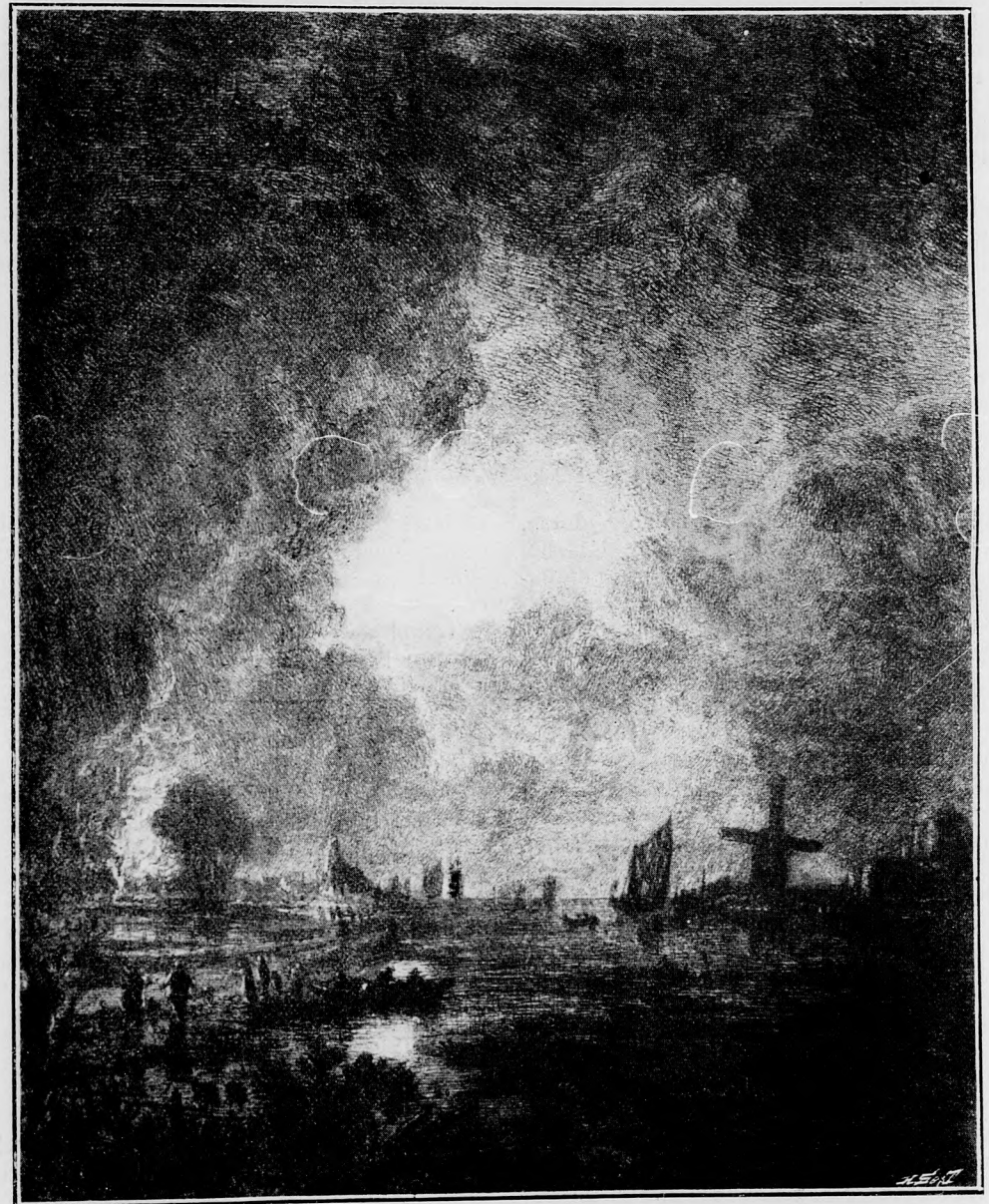
HOLLANDI TÁJKÉP. — VAN DER NEERÉ. — Az orsz. képtárból ellopott kép. —