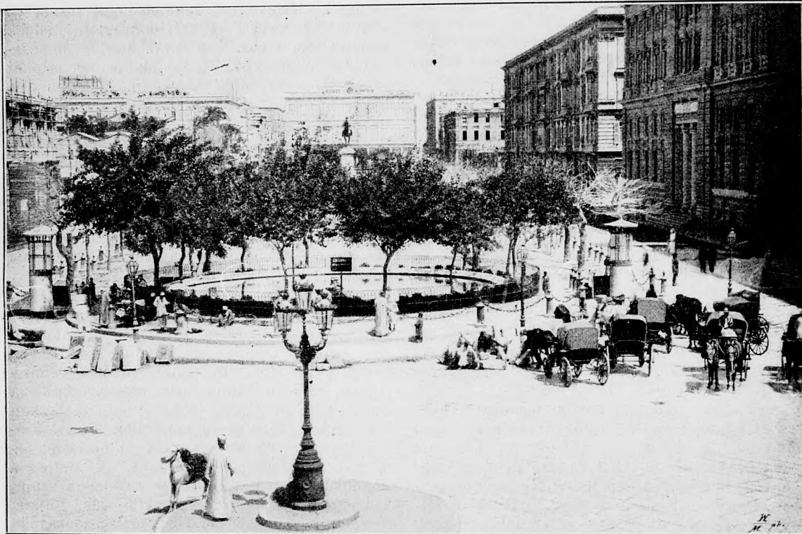
Alexandria. Mohamed Ali tér.

sége és zabolátlansága a lónak. Megelégszik eledelének úgy mennyiségével, mint minőségével, izlenek neki a legkeményebb és legkellemtlenebb növények is, melyeket a büszke ló és más állatok megvetnek. Jelképe az igénytelen, szurós tövisbogáncs. Egyrészt ragaszkodó, jó urát már messziről köszönti örvendező mozdulatokkal és megismeri bármely sokaságban is; másrészt pedig elég furfangos ahhoz, hogy tetszést arasson. Egy saint—manzi (Franciaország) tejes asszonyinak volt egy