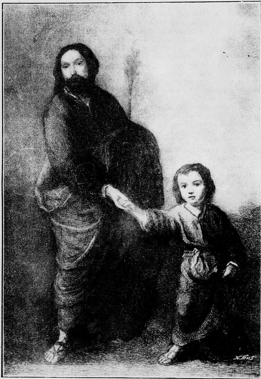
SZENT JÓZSEF ÉS A GYERMEK-JÉZUS. — Az orsz. képtárból ellopott Murilló-kép. —