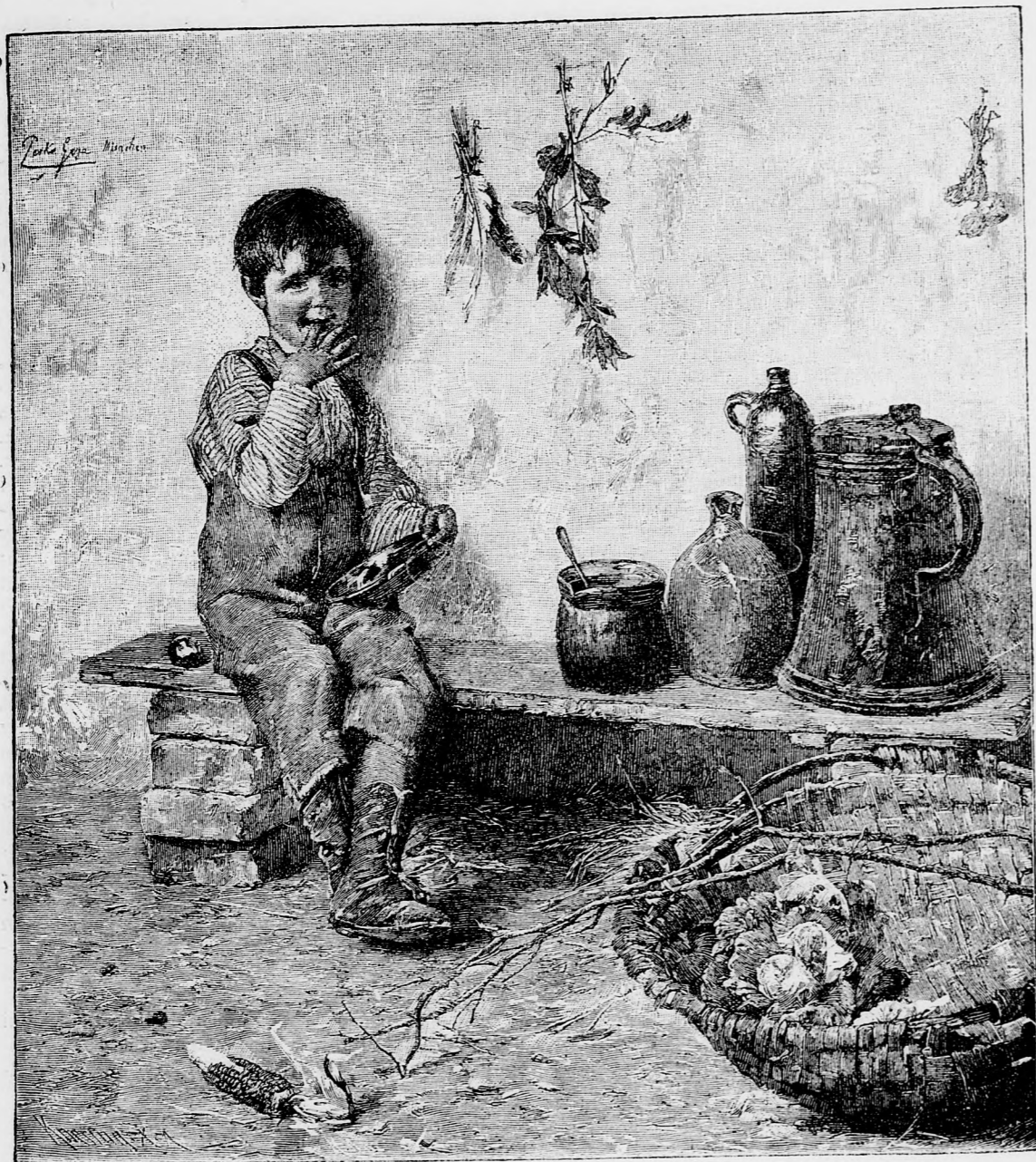
A KIS TORKOS.