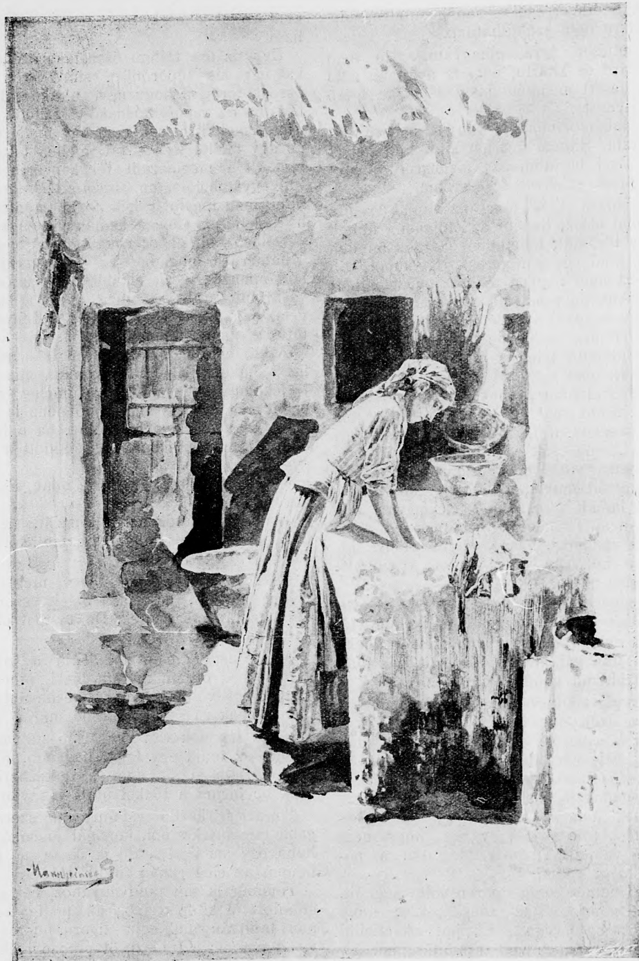
Mannheimer G. fest. nényo.