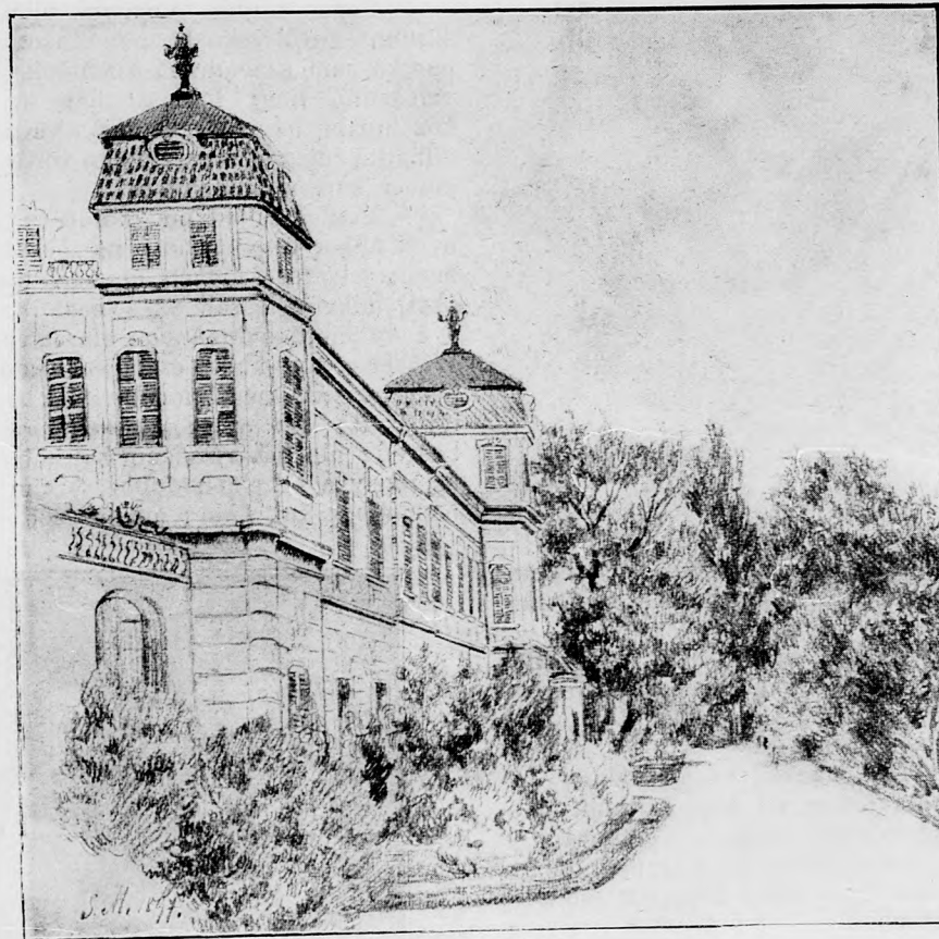
A tatai kastély, a hol a német császár lakott.