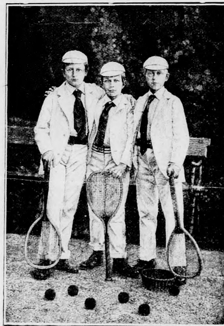
A német császár fiai.

E vakmerő indítványon elámulva, Náthán és Walker a torz-alaku emberre néztek, a trapper pedig nevetett, megsimogatta Puck borzas haját és így szólt: «Ez az én javas-emberemhez méltó beszéd; nincs a rétségen bátrabb szív, mint az, mely e kebelben dobog, uraim. Csakhogy nem megy ám, fiam; mi kevesen vagyunk és