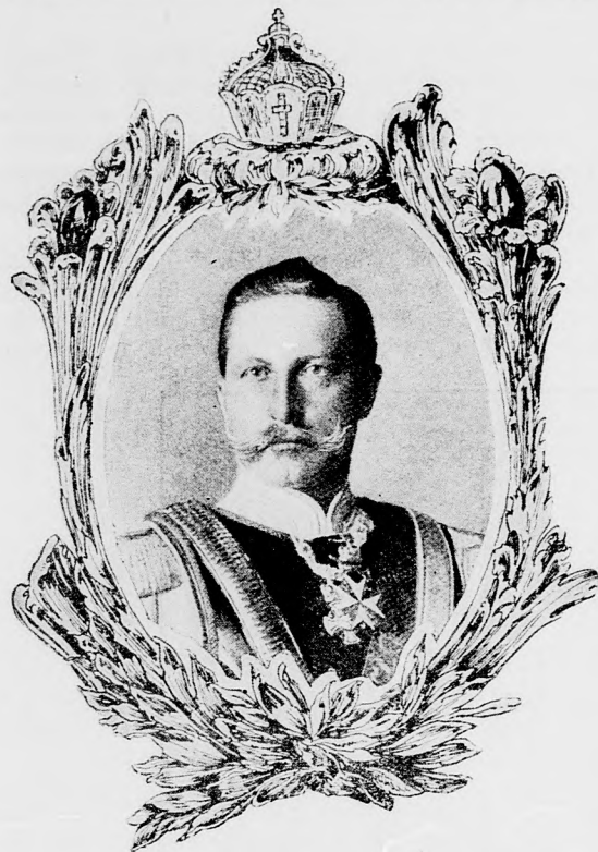
II. Vilmos német császár.

után részt vett a küzdelemben. A hallgatagon és komolyan ülő trapperhez e szavakkal fordult: