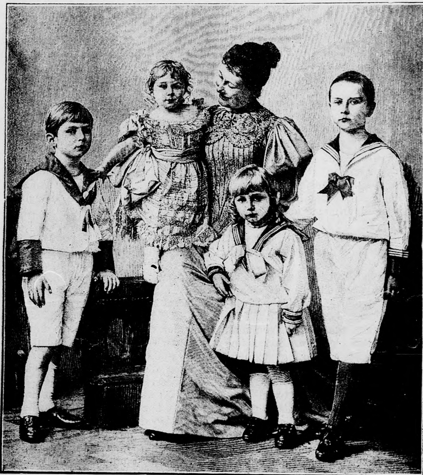
A NÉMET CSÁSZÁRNÉ LEGKISEBB GYERMEKEL.