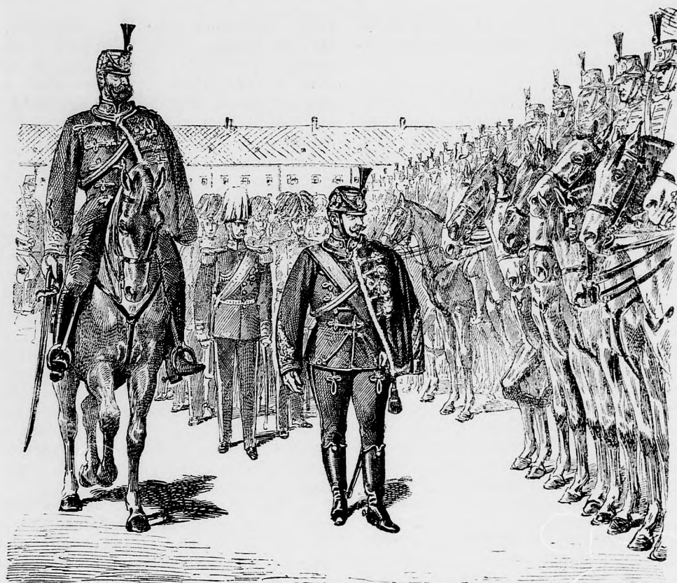
A német császár szemlét tart magyar huszárezrede fölött.