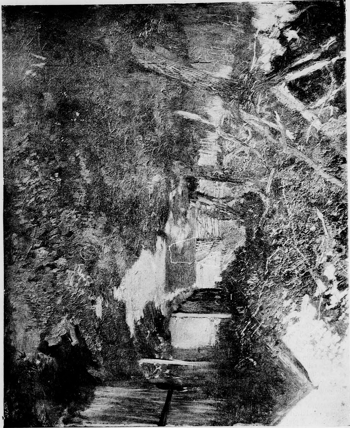
A KERT ALATT.